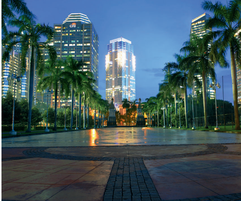
Nowoczesna Dżakarta nocą