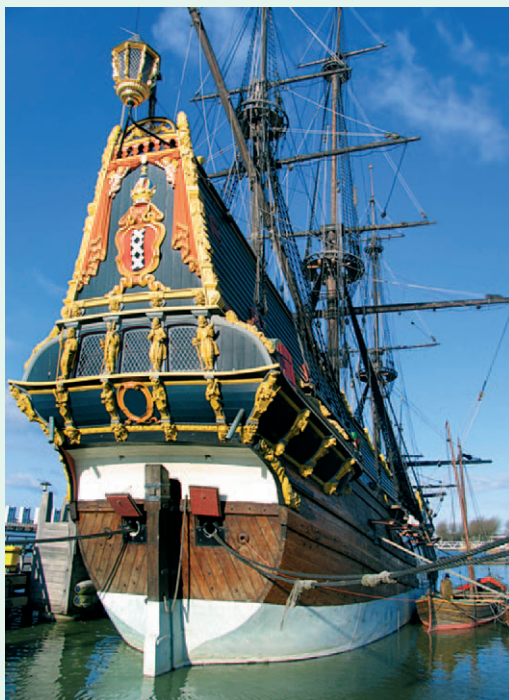
Statek VOC „Batavia”

Zamieszki w maju 1998 r. (1,2 tys. ofiar śmiertelnych i 5 tys. zniszczonych lub uszkodzonych budynków) były dla miasta wydarzeniem traumatycznym, takiej przemocy nie zaznano tutaj od ponad 30 lat. Punktem kulminacyjnym studenckich protestów było zajęcie parlamentu, które po kilku dniach doprowadziło do dymisji gen. Suharto. To jeden z ostatnich tragicznych epizodów w historii stolicy. Od tamtej pory Dżakarta pulsuje nowym, demokratycznym rytmem.